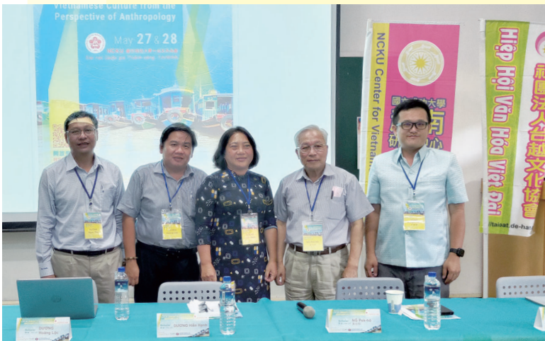
工作坊與會學者合影