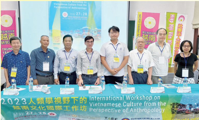
工作坊與會學者合影