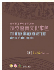
探索越南文化本色